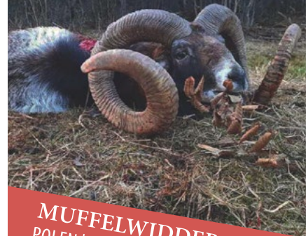
MUFFELWIDDER POLEN | SLOWAKEI | EUROPA