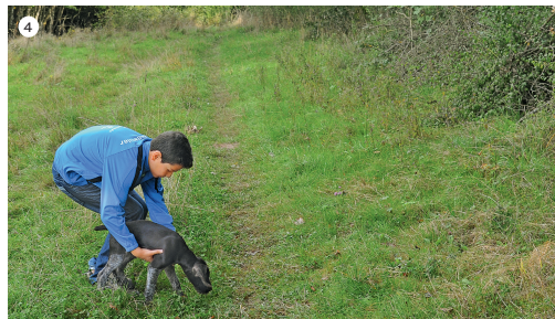
4 Ist der Hundeführer außer Sicht, wird der schon ungeduldig auf die Freilassung wartende Welpen von der Hilfsperson abgesetzt, ...

Der Welpen wird sowohl nach dem Überwinden von Hindernissen als auch nach erfolgreichem Abschluss auf der Hundeführerfährte vom Hundeführer stets freundlich empfangen. Überschwängliche Lobeshymnen sind unsinnig, denn allein die Erleichterung, beim Hundeführer wieder unmittelbaren Anschluss gefunden zu haben, beeindruckt ihn stark, positiv und nachhaltig.