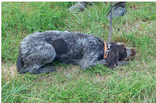
Das blitzschnelle Niedergehen aus dem »Sitz«, dem Stand und aus der Bewegung in die korrekte »Halt«-Lage muss erreicht werden, bevor weitere Ausbildungsschritte folgen.

Der angeleinte Hund sitzt links neben dem Hundeführer. Die Leine hat dieser unter seinem linken Fuß hindurchgezogen und hält sie in der rechten Hand. Eine klein-fingerdicke Haselnussgerete liegt in der linken Hand bereit. Mit dem Befehl »Halt« wird als Sichtzeichen der linke Arm senkrecht hochgehoben. Gleichzeitig wird die Leine mit kräftigem Ruck angezogen, was das Vorderteil des Hundes zu Boden zwingt. Stärkerer Widerstand oder ein Erhebungsver such wird sofort und mithilfe der Gerte kurz geahndet. Der Hund lernt sehr rasch, dass sein