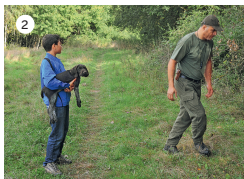
2 ... und verschwindet dann durch den Waldrand im Unterholz.