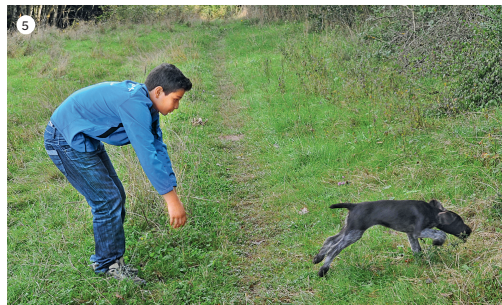
5 ... um endlich mit tiefer Nase die Verfolgung der Hundeführerfährte aufnehmen zu können. Beim Hundeführer angekommen, wird der Welpen freundlich in Empfang genommen.