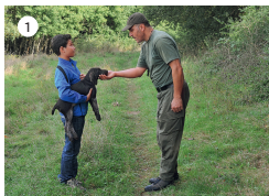
1 Führerfährte: Die neutrale Hilfsperson hält den Welpen, der Hundeführer »verabschiedet« sich ...