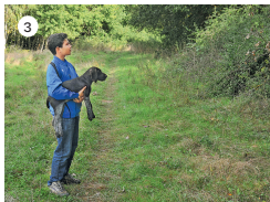
3 Der Welpen schaut seinem Hundeführer dabei sehnsüchtig hinterher.

wunden zu haben. Direkte Hilfen sind zu unterlassen! Vielmehr wird der Schwierigkeitsgrad so gewählt, dass diese Erfahrung der selbstständigen Überwindung garantiert ist.