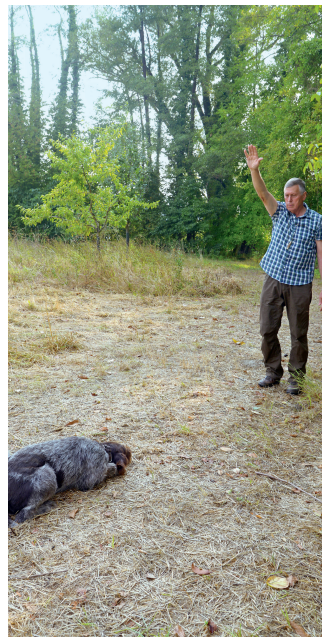
Das Laut-Kommando »Halt« wird mit dem Sicht-Kommando, dem Hochheben eines Armes, verbunden.

Der Befehl »Halt« erfolgt regelmäßig mit dem senkrechten Heben des Armes. Schließlich lässt man das Lautzeichen ganz weg und setzt das »Halt«-Machen allein auf das Sichtzeichen durch. Bei jedem Zögern, bei jeder Nachlässig-