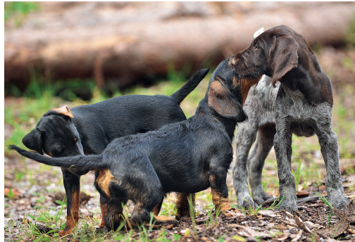
Erste Begegnung dreier Welpen bei einem Früherziehung-Lehrgang: Jagdterrier, Rauhaartecckel und Deutsch-Drahthaar.

Das Spielen ist ein verhaltensbiologisches Grundbedürfnis des Welpen. Es dient besonders