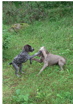
Die beiden Welpen mögen einander, wie das gemeinsame Spiel zeigt.

Der Welpen muss lernen, anderen Menschen ohne Scheu oder gar Aggression zu begegnen, ohne seinen Hundeführer als die wichtigste Bezugsperson in seinem Empfinden zu verlieren. Insgesamt geht es um die gesunde Wesensentwicklung des Hundes. Die leider nicht selten festzustellende Wesenslabilität (Wesensschwäche) ist häufig nicht (allein) genetisch bedingt, sondern Folge von Versäumnissen und Fehlern bei der Welpenerziehung. Dazu gibt es hinreichend Literatur (siehe Seite 141). Die Nutzung fachlich seriös geführter »Welpenlern- und -erziehungstage« wird empfohlen.