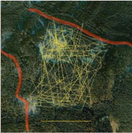
Das Revier des „Roten Mühlsteinbocks“ (r.) im Juni 2010. Zwei Forststraßen (rot) und ein Bestandsrand im Süden dienen als gut erkennbare Grenzen.