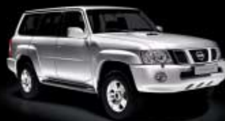
Abb. zeigt X-TRAIL, Navara, Patrol