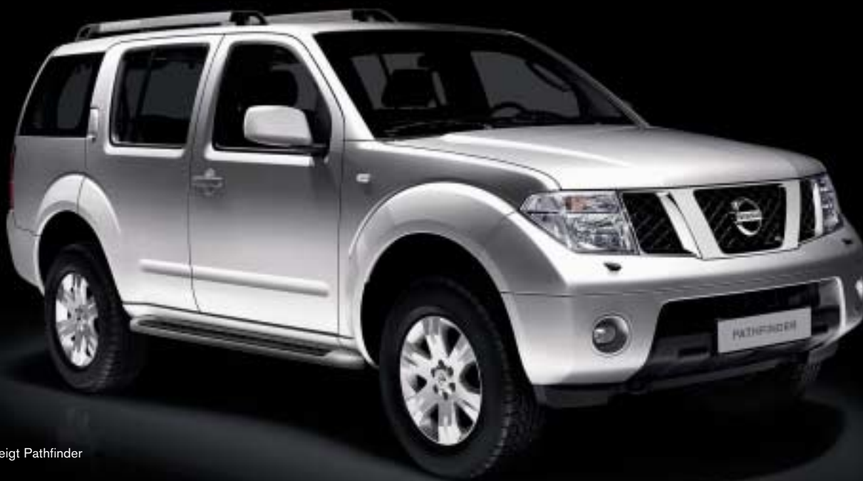
Abb. zeigt Pathfinder