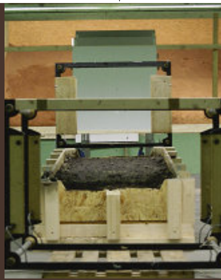
Das Abprallverhalten auf weichem Boden untersuchte die DEVA mit diesem Gestell.