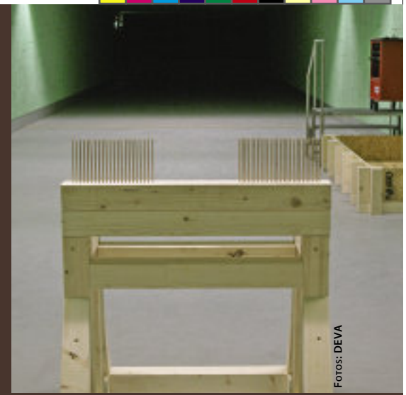
Mit dieser Konstruktion wurde der Schuss in ein Gebüsch simuliert.