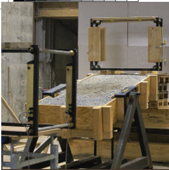
So sah der Versuchsaufbau für das Beschießen von hartem Boden aus.