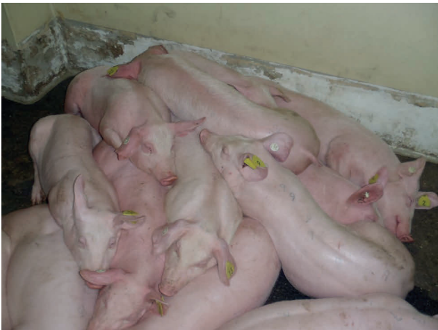
Abb. 3: Hausschweine mit hohem Fieber

Die Erkrankung ist auf der Basis klinischer Symptome nicht von der klassischen Schweinepest (KSP) und anderen schweren Krankheitsverläufen zu unterscheiden!