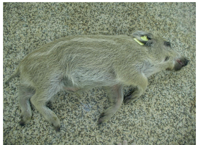
Abb. 5: Perakut verstorbener Frischling

Für den Antikörpernachweis in Serum und Plasma stehen mehrere, bisher in Deutschland nicht zugelassene ELISA-Kits zur Verfügung. Darüber hinaus können Antikörper mittels indirekter Immunfluoreszenz- oder Immunperoxidasetests nachgewiesen werden. Immunoblots werden ebenfalls eingesetzt. Probenmaterial der Wahl ist Serum.