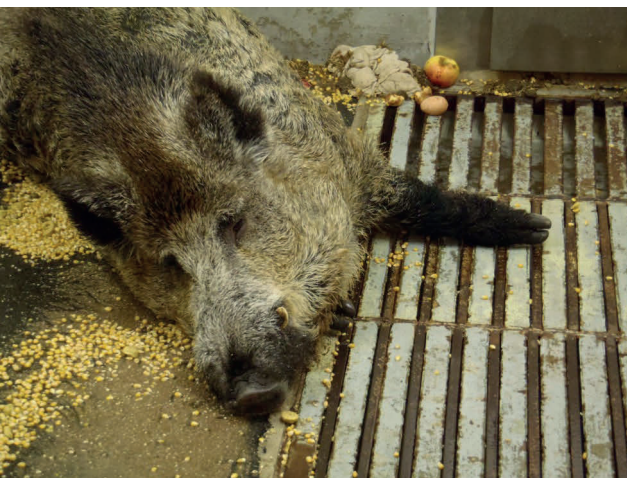
Abb. 4: Keiler mit unspezifischen Symptomen