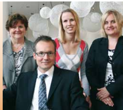
Ihr IWA & OutdoorClassics Team Your IWA & OutdoorClassics team

waren zufrieden mit Organisation und Service were satisfied with the organization and service