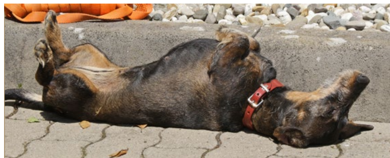
Teckel-Dame „Vroni“ lässt es sich gut gehen und nimmt ein ausgiebiges Sonnenbad.

Unaufgeregt und familiär war die Atmosphäre bei dem Fotoshooting. Die Hunde dösten in der für diesen Tag extra bestellten Sonne, Herrchen und Frauchen plauderten miteinander und lernten einige Redakteure von WILD UND HUND kennen. Ab und zu ging ein Hunde-Mensch-Gespann in den Verlag. Dort wartete schon Christine Kaltenbach, um die Vierläufer in Szene zu setzen. Mit Unterstützung ihrer charmanten Assistentin, Quietschbällen und Futterbrocken animierte sie die Jagdbegleiter, aufmerksam in die Kamera zu schauen, um im richtigen Moment auf den Auslöser zu drücken. Und das natürlich vor einem jagdlichen Ambiente. Die meisten Leser hatten noch einige Accessoires mitgebracht. Darunter ein riesiges Bärenfell und eine alte Nachsuchenbüchse. Alle Hunde arbeiteten beim Shooting gut mit. Die Fotografin ging auch auf Sonderwünsche ein. So durfte beispielsweise der jagdliche Nachfolger mit aufs Bild